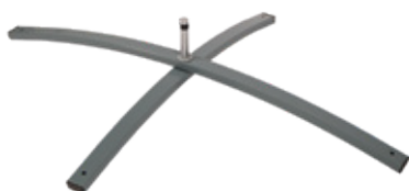
Base a croce Art. 2033 dim. (piegato) 78 x 3cm (per uso interno ed esterno) dim. (aperto) 78 x 60cm Peso: 4 kg