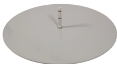
Base autoportante Art. 2005 diam. 50 cm (per uso interno ed esterno) Peso: 5 kg

Istruzioni di montaggio: Inserire il perno nella parte superiore del picchetto e bloccarlo con i pomelli. Far passare l'astina attraverso i 2 fori presenti sulla parte superiore del picchetto.