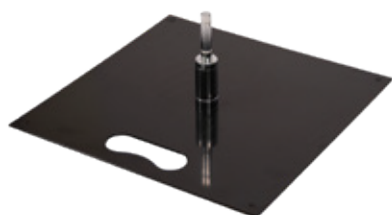
Base a piastra Art. 2034 dim. 40 x 40 x 0.4cm (per uso interno ed esterno) Peso: 5kg