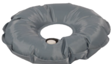
Sacca d'acqua in PVC Art. 2035 diam. 40 cm (per uso interno ed esterno) Peso (riempito d'acqua): 6 kg