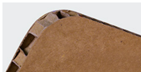
Nidoboard 16 mm avana

Per realizzare il file corretto è importante creare la grafica utilizzando il template scaricabile dal sito, oppure dal link nella mail di conferma d'ordine e consultare le istruzioni di preparazione file dedicate.