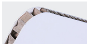
Nidoboard 16 mm bianco