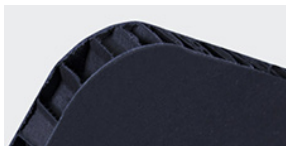
Nidoboard 16 mm nero